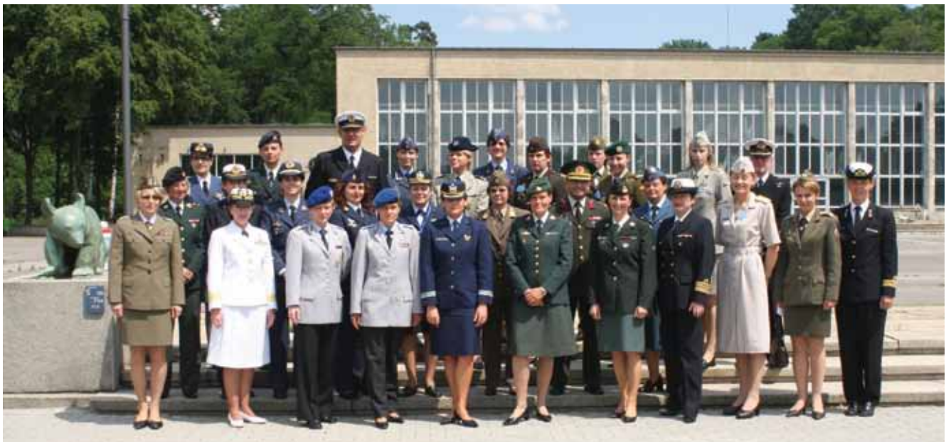
באי ועידה שדנה בשילוב נשים בכוחות נאט"ו, ברלין 2007 | ב-15 מתוך 22 מדינות נאט"ו יכולות נשים למלא בצבא כל תפקיד שבו יחפצו - כולל תפקידי לחימה

ערכי המשפחה נחשבים למרכזיים בקרב שכבות רחבות בציבור. כבר ראש הממשלה הראשון, דוד בן-גוריון, עודד הקמתן של משפחות גדולות ובכך קשר אידיאולוגיות ומסורות דתיות ועדתיות ואיחודן